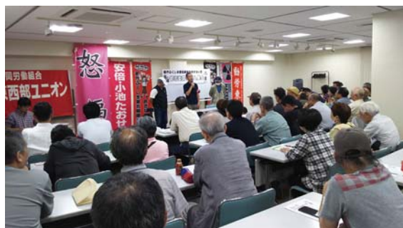
熱気に満ちた都労委闘争突入集会