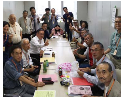
都労委に結集した仲間たち